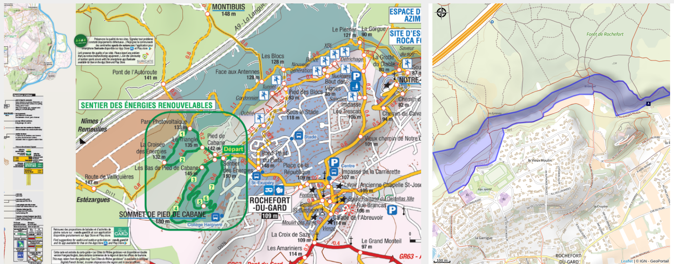
Carte des secteurs - Extrait du cartoguide "Les Côtes du Rhône gardoises"