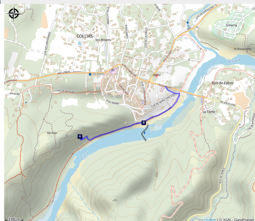
Site d'escalade Collias - Grande Face

Ce site offre des lignes vertigineuses et des panoramas superbes sur le Gardon et ses gorges. Juste à côté, la via ferrata permet d'explorer les falaises autrement: échelles, pont de singe et tyrolienne offrent une aventure sécurisée, accessible aux curieux comme aux sportifs.