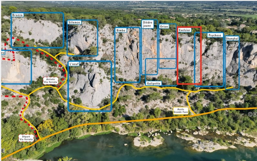
Site d'escalade Collias - Grande Face