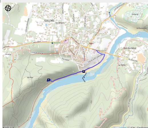
Site d'escalade Collias - Grande Face

Ce site offre des lignes vertigineuses et des panoramas superbes sur le Gardon et ses gorges. Juste à côté, la via ferrata permet d'explorer les falaises autrement: échelles, pont de singe et tyrolienne offrent une aventure sécurisée, accessible aux curieux comme aux sportifs.