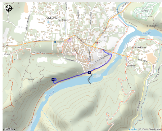
Site d'escalade Collias - Grande Face

Ce site offre des lignes vertigineuses et des panoramas superbes sur le Gardon et ses gorges. Juste à côté, la via ferrata permet d'explorer les falaises autrement: échelles, pont de singe et tyrolienne offrent une aventure sécurisée, accessible aux curieux comme aux sportifs.