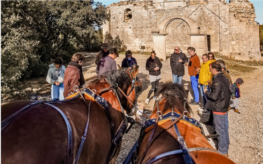
Crédit : Chevaux et participants devant les vestiges d'une église (Les Attelages du Vidourle)