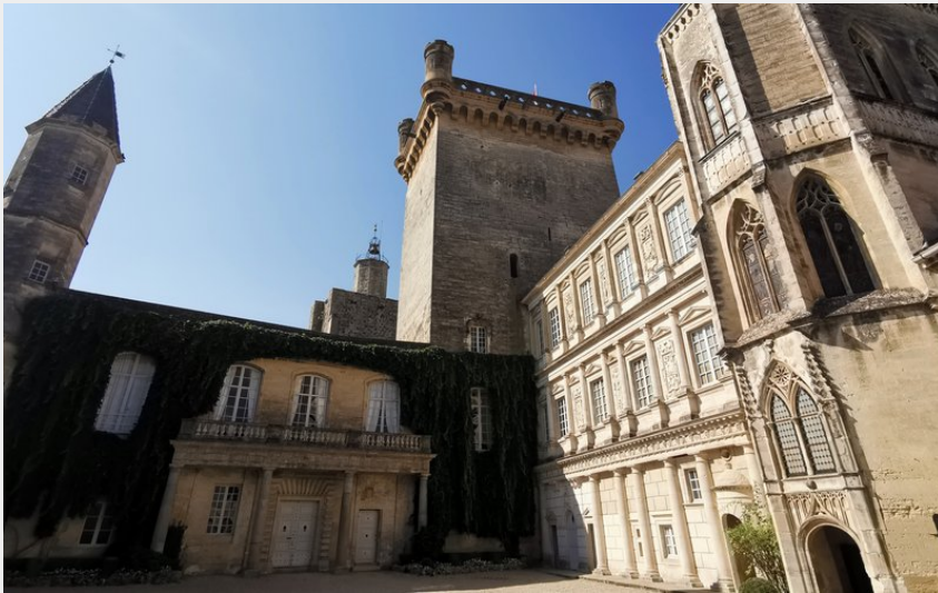
Crédit : Façade Renaissance, Tour Bermonde, chapelle gothique et Tour de la Vicomté (Duché d'Uzès)