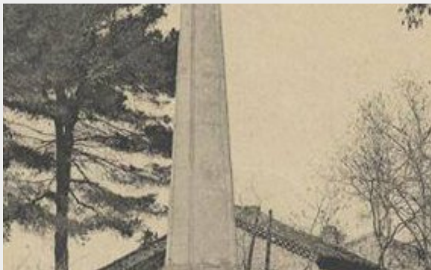
Crédit : Obélisque-St Christol lez Alès