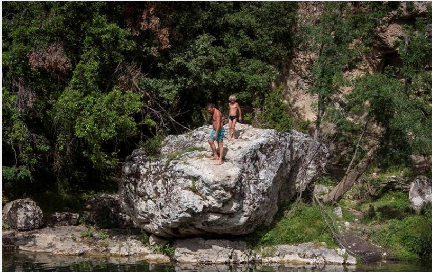
Crédit : plage, rivière, gorges, cèze (Droits libres plage, rivière, gorges, cèze)