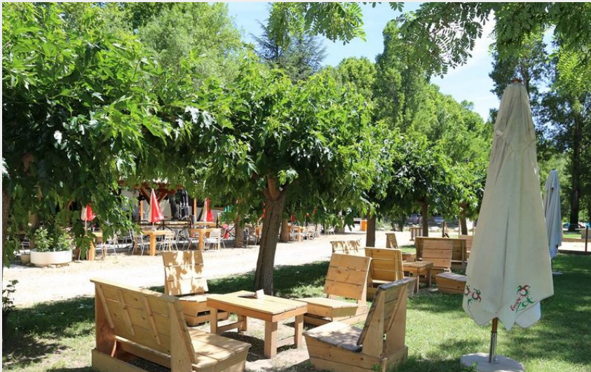
Crédit : Espace détente ombragée avec salon de jardin (Camping La Plage)