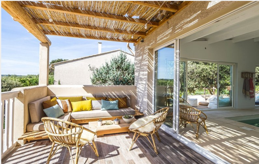
Crédit : une villa dans son jardin méditerranéen (droit d'auteur Les Petits Gardons)