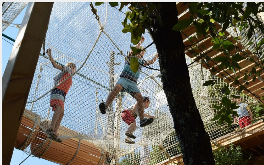
Crédit : Grotte de la Salamandre accro bambino (Grotte de la Salamandre)