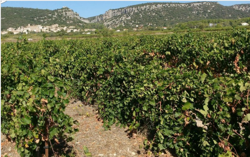
Piémont cévenol