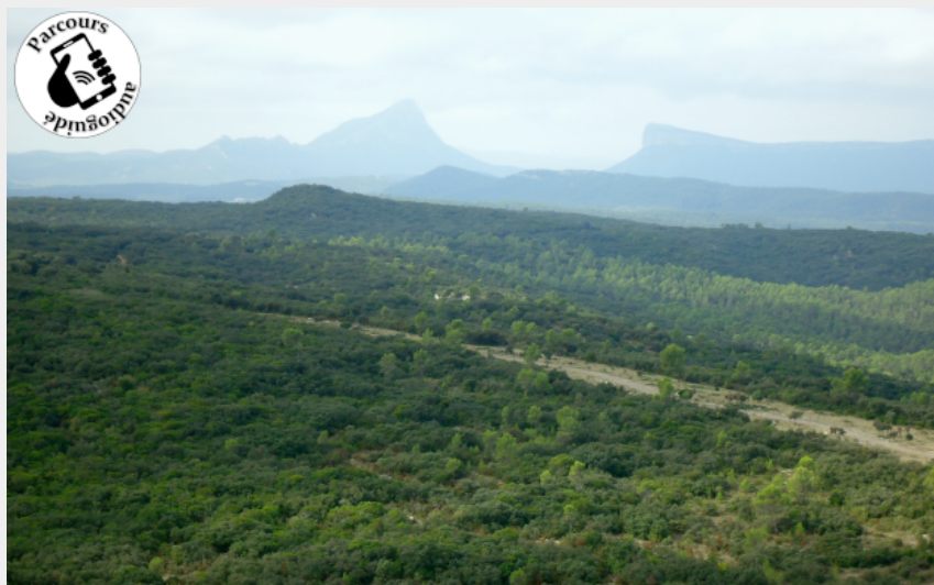
Vue sur Pic Saint Loup et Hortus