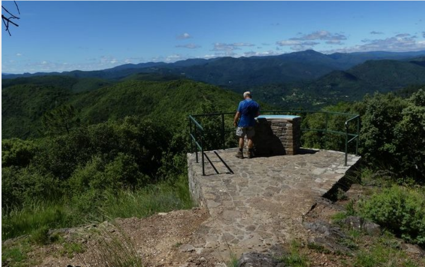
Point de vue (N Thomas)