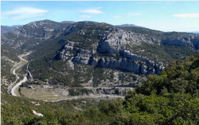
le Ranc de Banes