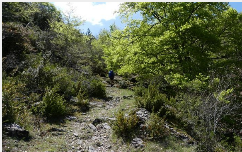
Montée sur la Can