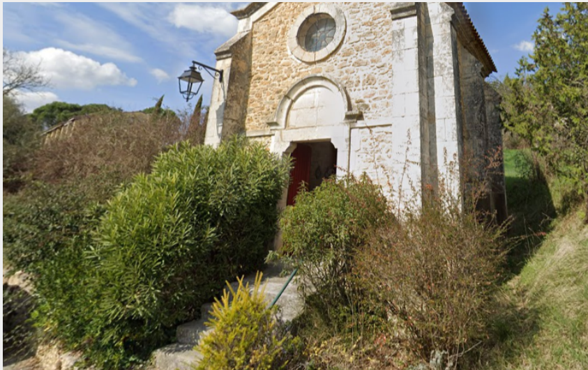
Chapelle de Goussargues Google Earth (à modifier après phase de test)