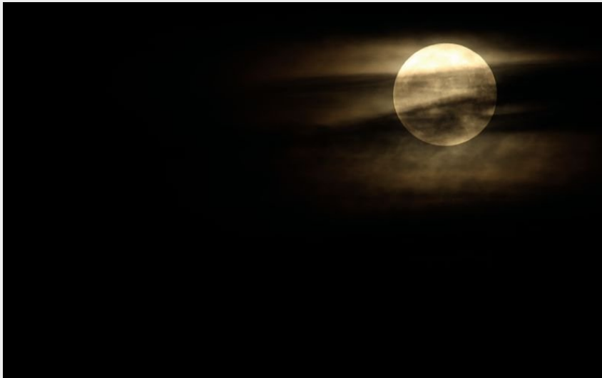
Lever de lune (B Descaves)