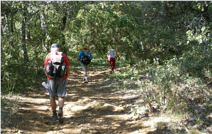
Rando en forêt