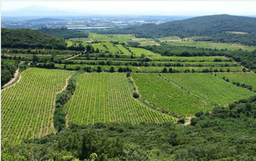
Panorama sur le vignoble