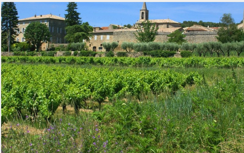
Vue sur le village de St Michel d'Euzet