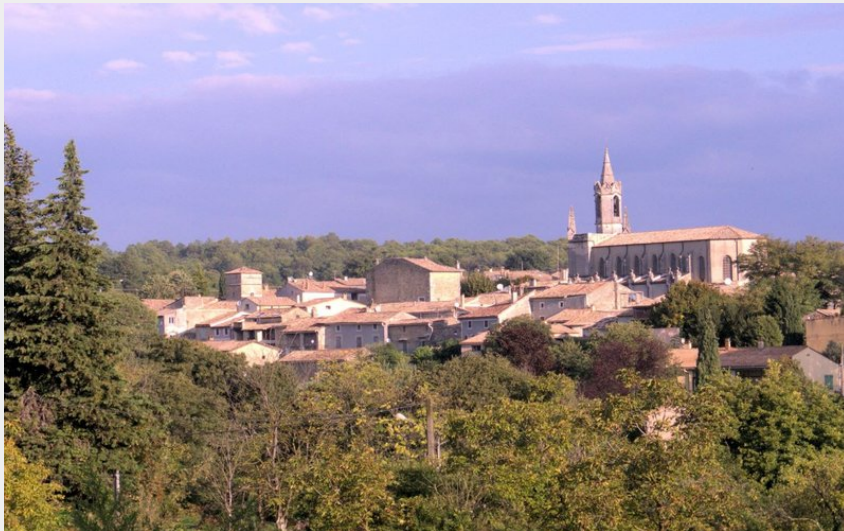
Village de Saint Marcel de Careiret (Mairie St Marcel de Careiret)