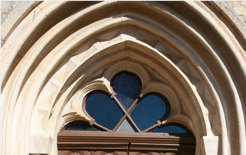
Porte de l'église de Saint Christol de Rodières